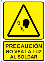
PRECAUCIÓN NO VEA LA LUZ AL SOLDAR