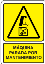
MÁQUINA PARADA POR MANTENIMIENTO