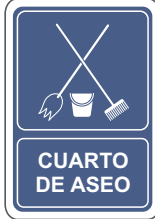
CUARTO DE ASEO