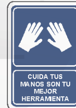
CUIDA TUS MANOS SON TU MEJOR HERRAMIENTA