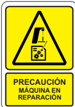
PRECAUCIÓN MÁQUINA EN REPARACIÓN