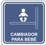
CAMBIADOR PARA BEBÉ