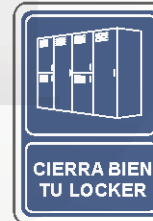
CIERRA BIEN TU LOCKER