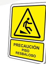
PRECAUCIÓN PISO RESBALOSO ( PARA PISO )