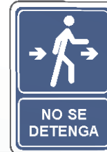
NO SE DETENGA