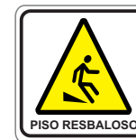
PISO RESBALOSO CON TEXTO