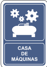
CASA DE MÁQUINAS