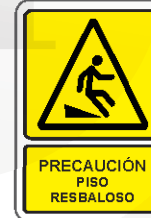
PRECAUCIÓN PISO RESBALOSO