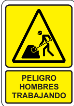
PELIGRO HOMBRES TRABAJANDO