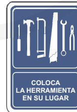
COLOCA LA HERRAMIENTA EN SU LUGAR