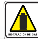
INSTALACIÓN DE GAS