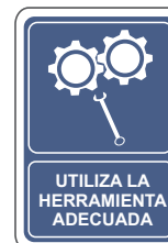
UTILIZA LA HERRAMIENTA ADECUADA