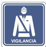
VIGILANCIA CON TEXTO