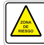
ZONA DE RIESGO