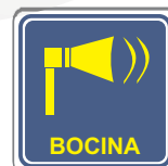
BOCINA CON TEXTO