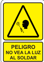
PELIGRO NO VEA LA LUZ AL SOLDAR